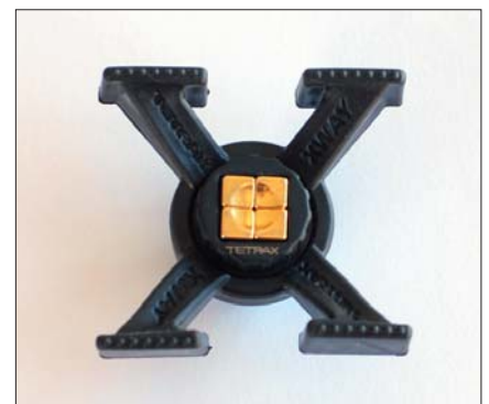
Deutlich erkennt man die vier vergoldeten Magneten und die vier Vibrationsdämpfer aus Gummi

men, sondern nur welche aus Metall. Die Geo-Line ist das Standardmodell ohne die vier kreuzförmigen Vibrationsbremsen, diese Modelle halten Geräte bis 150 Gramm Gewicht, also auch Handys oder MP3-Player. Die Fix-Line schließlich wird direkt auf glatte Oberflächen geklebt und hält ebenfalls 150 Gramm.