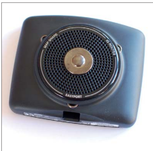
Die dünne Metallplatte reicht aus, damit das Navi von den Magneten gehalten wird.

Tetrax Fix-Line (Klebefestigung) 9,90 Euro