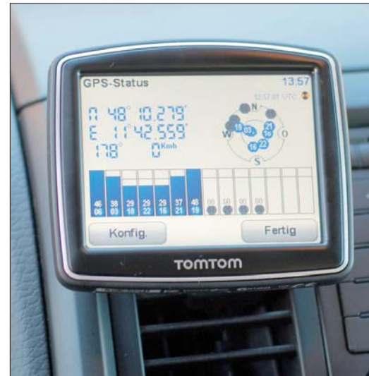
Hält fest am Lüftungsgitter: Das mit dem Tetrax-System befestigte TomTom-Navi

Alternativ zum XWay gibt es auch das Modell der Ego-Line. Die haben aber keine Gummi-Klem-